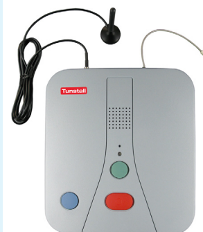
© Tunstall Verschiedene Modelle zur Auswahl